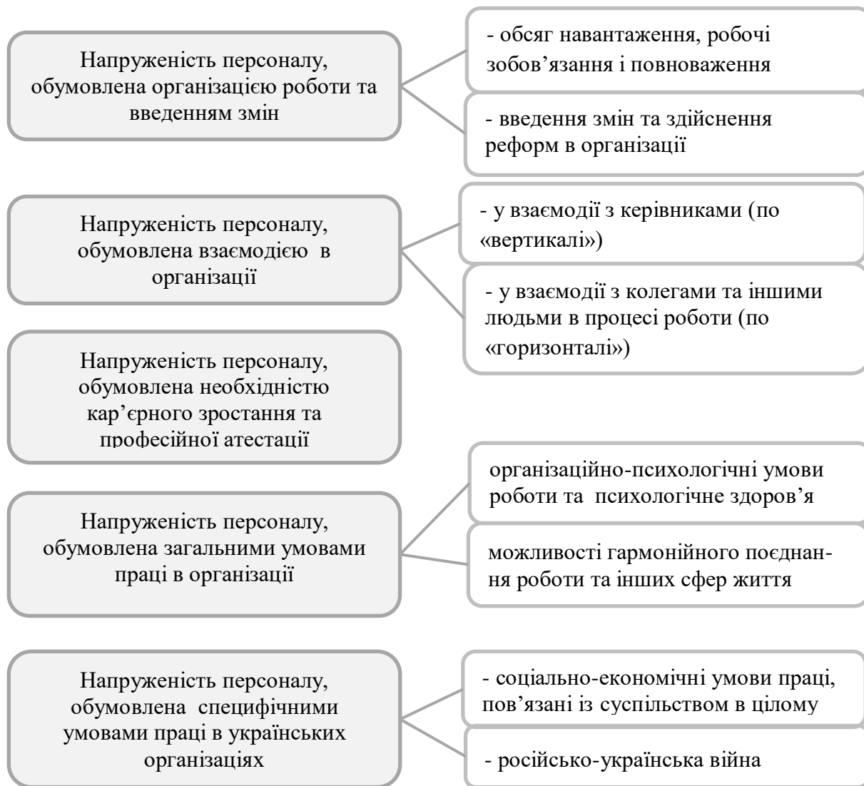
Рис. 2. Типи та складові організаційної напруженості персоналу (на прикладі освітніх організацій)

потребує активності на макрорівні (територіальних громад, професійних спілок, відповідних урядових рішень та програм).