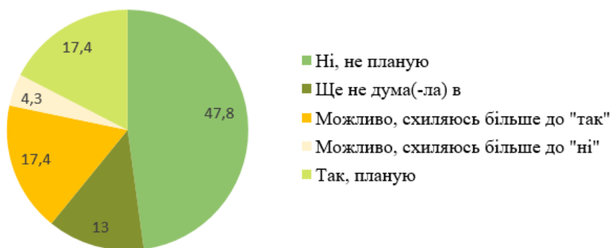
Рис. 2. Результати опитування: чи плануєте Ви отримати додаткову освіту після закінчення служби

В більшості досліджень здобуття додаткової освіти виділяють як окремий вид реабілітації. Ми підтримуємо таку думку, адже в такому випадку людина здобуває нові знання і буде шукати роботу в конкретному напрямку. Результати нашого дослідження представлені в діаграмі (рис. 2).