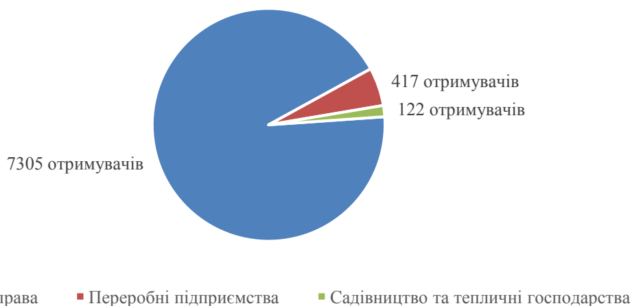
Рис. 2. Кількість виданих грантів в період липень 2022- жовтень 2023 рр.