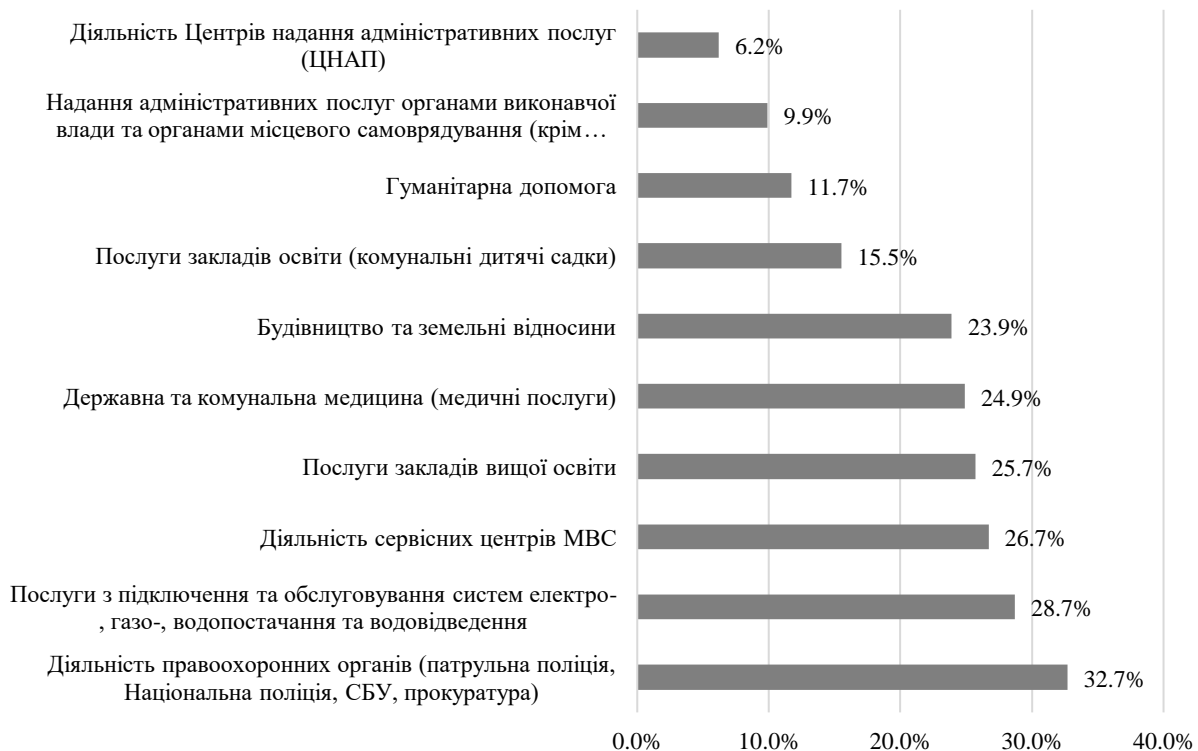
Рис. 2. Рівень корупційного досвіду серед населення у 2022 році, %

Як показали опитування корупційного досвіду населення (корупційний досвід за самооцінкою), протягом 2022 року (рис. 2), найбільш корумпованими є правоохоронні органи, послуги водопостачання та водовідведення, сервісні центри МВС, медичні послуги, будівництво та земельні ділянки та інші.