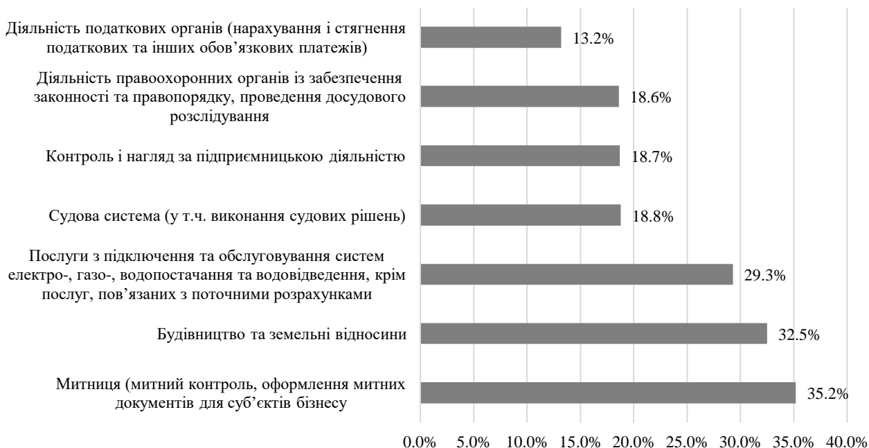
Рис. 3. Рівень корупційного досвіду серед бізнесу у 2022 році, %

Щодо досвіду бізнесу у корупційній сфері (рис. 3) лідируюча частка належить митниці – 35,2 %.