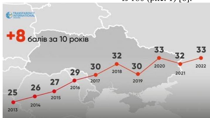
Рис. 1. Кількість балів України в Індексі сприйняття корупції протягом 2013-2022 років

В Україні, оцінку рівня сприйняття корупції (Corruption Perceptions Index — CPI) здійснює Трансперенсі Інтернешнл Україна (Transparency International Ukraine). Протягом 2022 року, в Індексі сприйняття корупції, Україна отримала 33 бали (із 100 можливих) і зайняла 116 місце із 180 (рис. 1) [6].