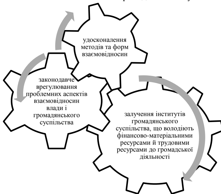
Рис. 3. Механізм оптимізації взаємовідносин органів державної влади та інститутів громадянського суспільства

Актуальною є ще одна форма взаємодії влади з громадськістю – електронне врядування та спілкування за допомогою інформаційних технологій. Використання органами публічної влади у своїй діяльності мережі Internet дозволяє не тільки надавати інформацію про свою діяльність, а й отримати інформацію про якість своєї роботи та отримати пропозиції щодо її покращення. Тому доцільно систематизувати необхідні напрямки оптимізації взаємовідносин органів державної влади та інститутів громадянського суспільства (рис. 3).