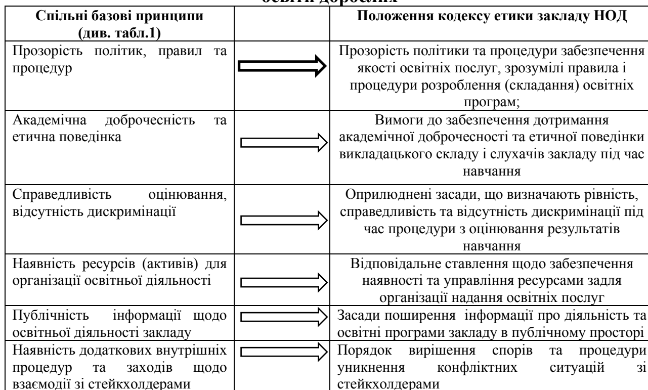
Таблиця 2. Формування положень кодексу етики закладу неформальної освіти дорослих