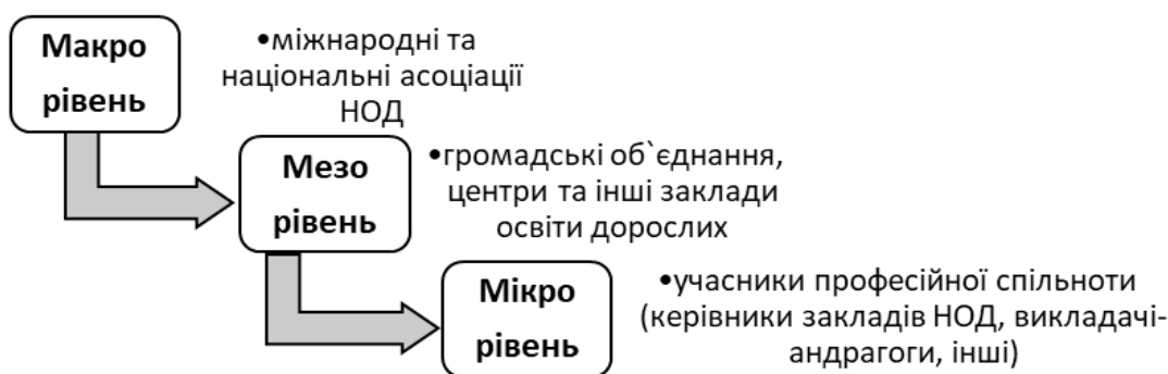
Рис.1 Рівні відповідальності формування засад розвитку неформальної освіти дорослих

жорстких стандартів, та орієнтується на конкретні освітні запити різних соціальних, професійних, демографічних груп населення.[8] Проте формування засад розвитку НОД відбувається також на відповідних рівнях: міжнародних та національних асоціацій, громадських об'єднань, центрів освіти дорослих та учасників професійної спільноти (керівників закладів НОД, викладачів-андрагогів, та інших стейкхолдерів) (рис.1).