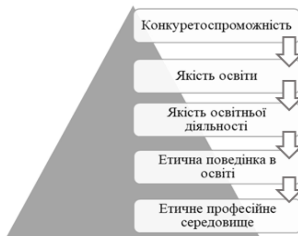
Рис. 3. Чинники створення етичного професійного середовища в закладі освіти