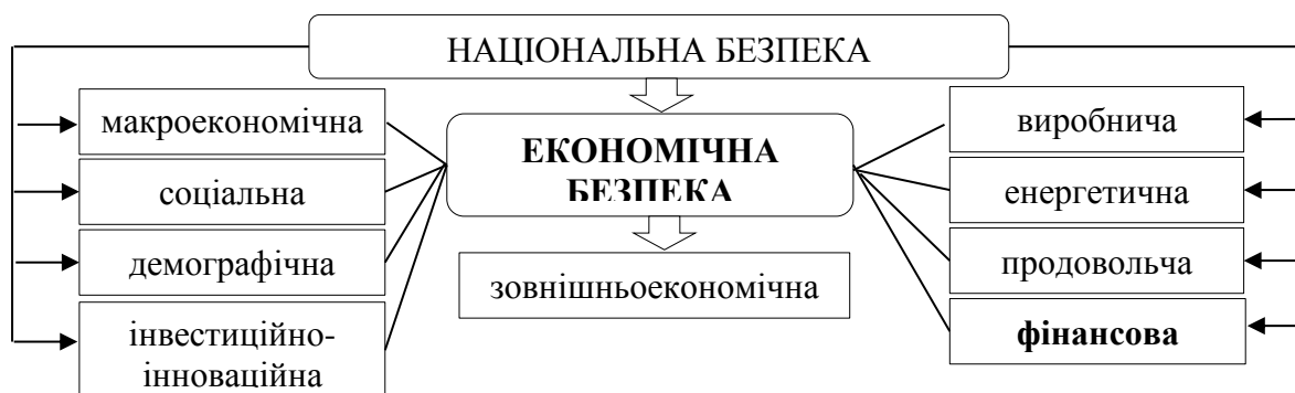
Рис. 1. Місце фінансової безпеки в системі економічної безпеки держави

Наявність значної кількості ризиків і загроз фінансового характеру, які чинять значний деструктивний вплив на сферу фінансово-економічних відносин, провокують зниження рівня фінансової, а відповідно і економічної безпеки держави, що доводить їх взаємозв'язок та взаємообумовленість. На рис. 1 вважаємо за доцільне відобразити місце фінансової безпеки в системі економічної безпеки держави.