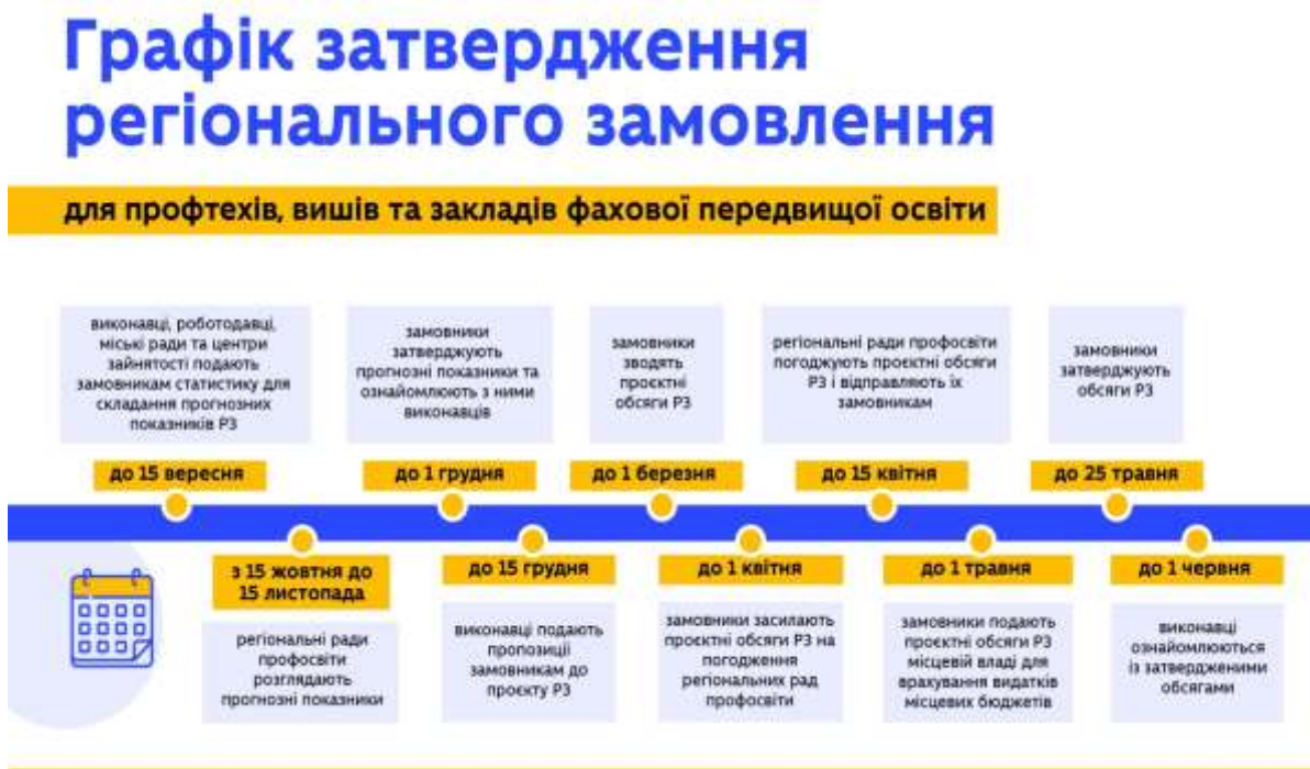
Рис. 3. Графік затвердження регіонального замовлення

професійної (професійно-технічної), фахової передвищої та вищої освіти, з яким укладено контракт на підготовку фахівців та робітничих кадрів за регіональним замовленням.