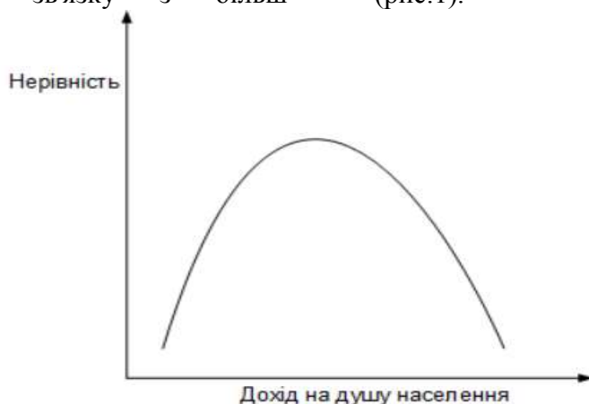
Рис. 1. Крива С. Кузнеця в трансформаційних економіках

ефективною системою перерозподілу. Аналогічні тенденції спостерігалися і для більшості постсоціалістичних країн (рис.1).