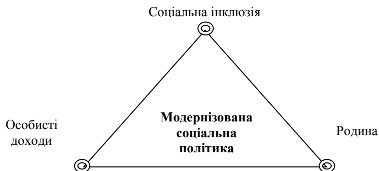
Рис. 2. Модернізована соціальна політика на основі соціальної інклюзії

або УБД. Тому ми пропонуємо модернізувати соціальну політику на основі абсолютно іншого підходу, а саме на основі соціальної інклюзії (Рис.2).