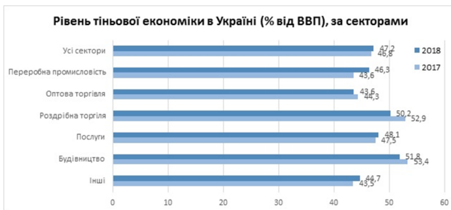
Рис. 2. Тіньова економіка по секторам

дослідження внутрішніх та зовнішніх фундаментальних факторів, що впливають на рівень економічної безпеки, можливості конкурентоспроможності та динамічного зростання національної економіки, підвищення якості життя населення.