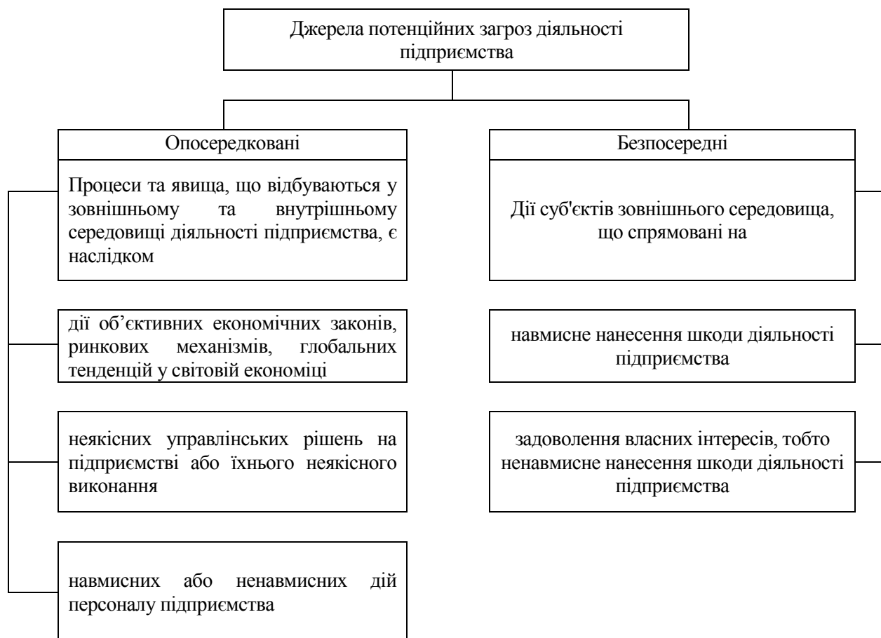
Рис. 2. Джерела потенційних загроз діяльності підприємства

Передумови для реалізації загрози (або загроз) діяльності підприємства утворюються як комбінації умов, процесів та обставин суб'єктивного та об'єктивного характеру у внутрішньому середовищі підприємства. У цих комбінаціях вплив однієї умови (ситуації або процесу) може посилювати (або гальмувати) вплив інших, тобто виступати як їхній каталізатор або інгібітор. Такі комбінації у внутрішньому середовищі підприємства численні і можуть швидко змінюватися завдяки зміні елементів комбінації та їхньої ролі (домінуюча, другорядна та ін.). Якщо б йшлося про одну комбінацію умов, процесів та обставин у внутрішньому середовищі підприємства, то її достатньо легко можна виявити, вивчити її структуру, знайти способи управлінського впливу на її елементи. Але у кожний конкретний момент часу таких комбінацій може бути багато, що, власне, і визначає вимогу оперативності до