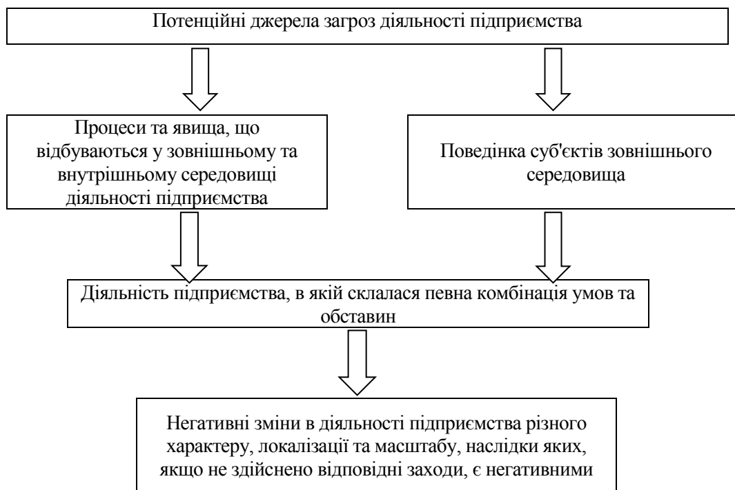
Рис. 1. Складові визначення поняття «загроза діяльності підприємства»

Процеси та явища, що виникають і набувають актуальності у зовнішньому середовищі, загалом за своєю природою стосовно діяльності підприємства є індиферентними та безсуб'єктивними. Але в діяльності підприємства можуть мати місце певні умови, обставини або ситуації, наявність яких спричиняє вплив негативного характеру цих процесів та явищ, тобто створює передумови для перетворення індиферентних за своєю природою процесів та явищ зовнішнього середовища на загрози діяльності підприємства.