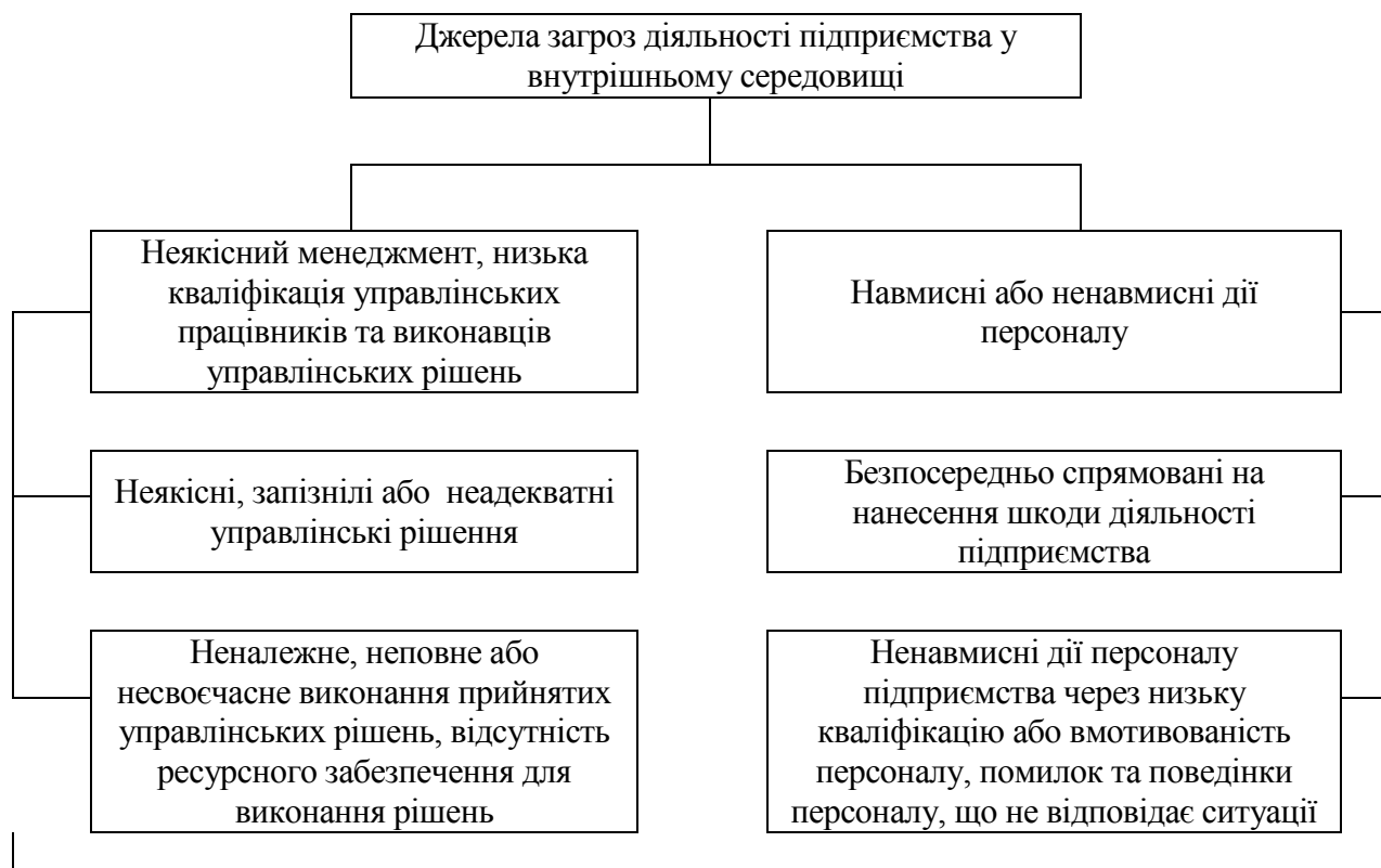
Рис. 4. Процеси та явища у внутрішньому середовищі підприємства як загрози його діяльності

У внутрішньому середовищі діяльності підприємства загрози виникають і через дії персоналу, які можуть бути: