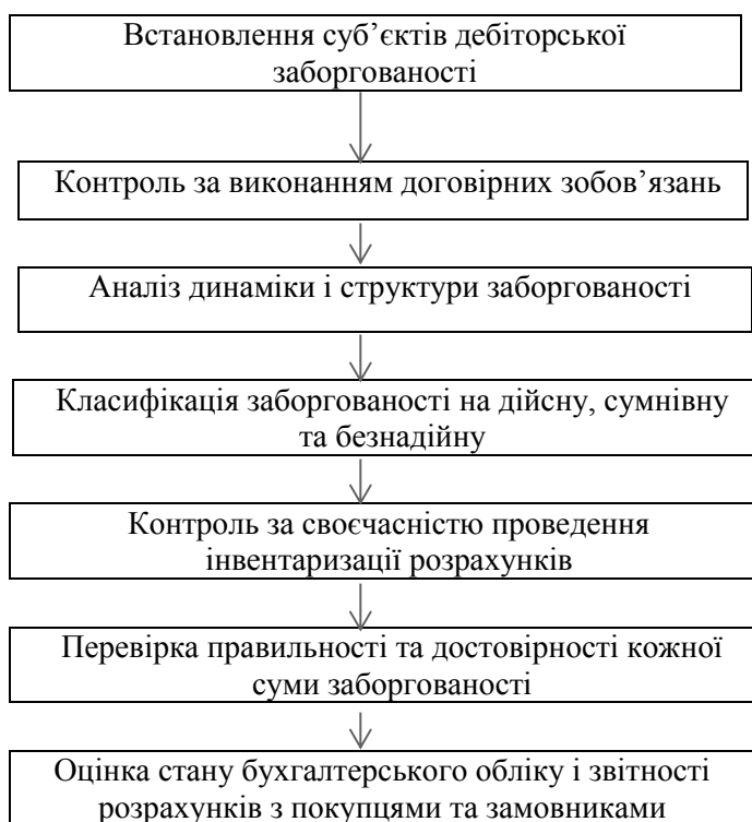
Рис. 1. Послідовність проведення контролю розрахунків з покупцями та замовниками

4. Якщо покупець відмовився прийняти та оплатити товар, продавець має право за своїм вибором вимагати оплати товару або відмовитися від договору купівлі-продажу.