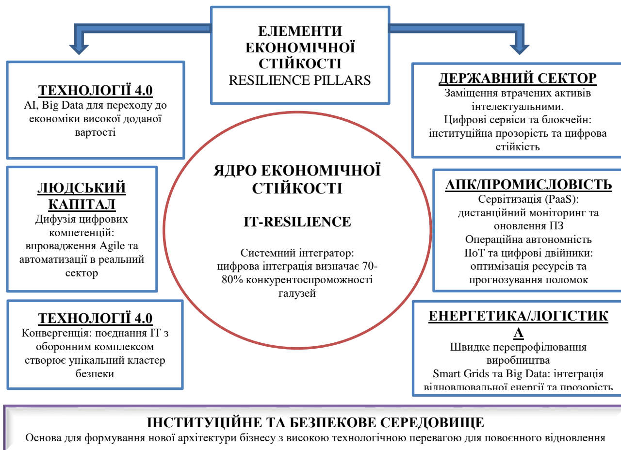
Рис. 1. IT-сектор як системний інтегратор Industry 4.0 та основа економічної стійкості України