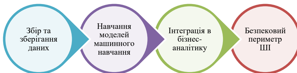
Рис. 1 Архітектура впровадження штучного інтелекту на підприємстві

необхідною є наявність зрілої інфраструктури даних підприємства. Відсутність консолідованих та верифікованих масивів інформації суттєво знижує прогностичну здатність та релевантність результатів нейромережевого моделювання. Типова архітектура впровадження представлена на рис. 1.