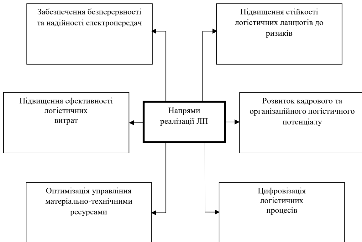
Рис. 3. Ключові напрями в реалізації ЛП ЕПК