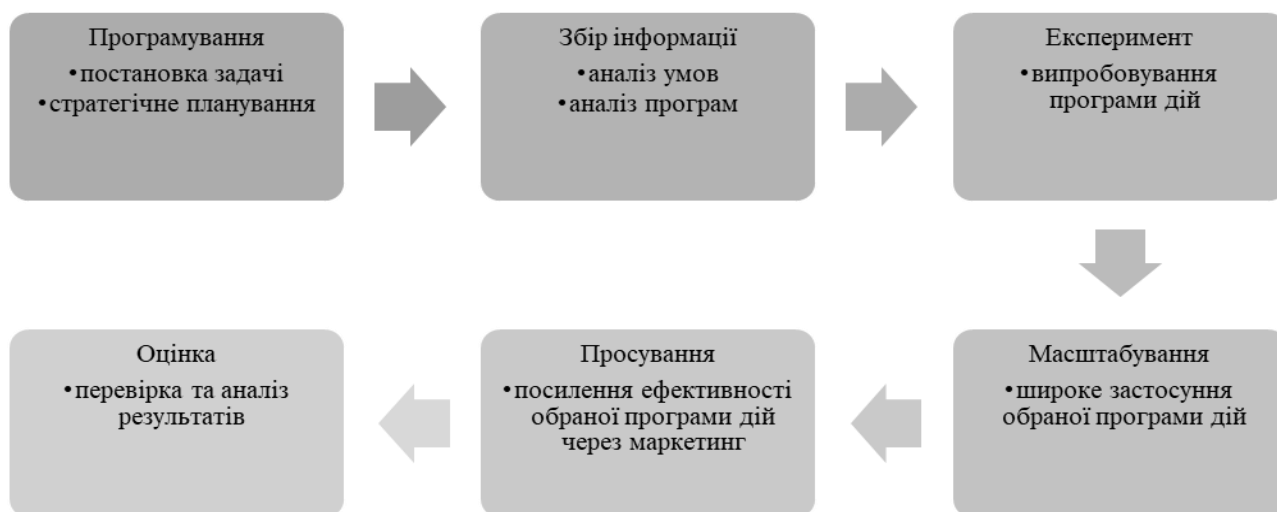
Рис. 3. Процес управління розвитком туристичної дестинації

Концепція життєвого циклу допомагає обрати відповідну стратегію з огляду на фактори впливу. Процес управління розвитком туристичної дестинації з урахуванням концепції життєвого циклу складається з поступових кроків (рис. 3).