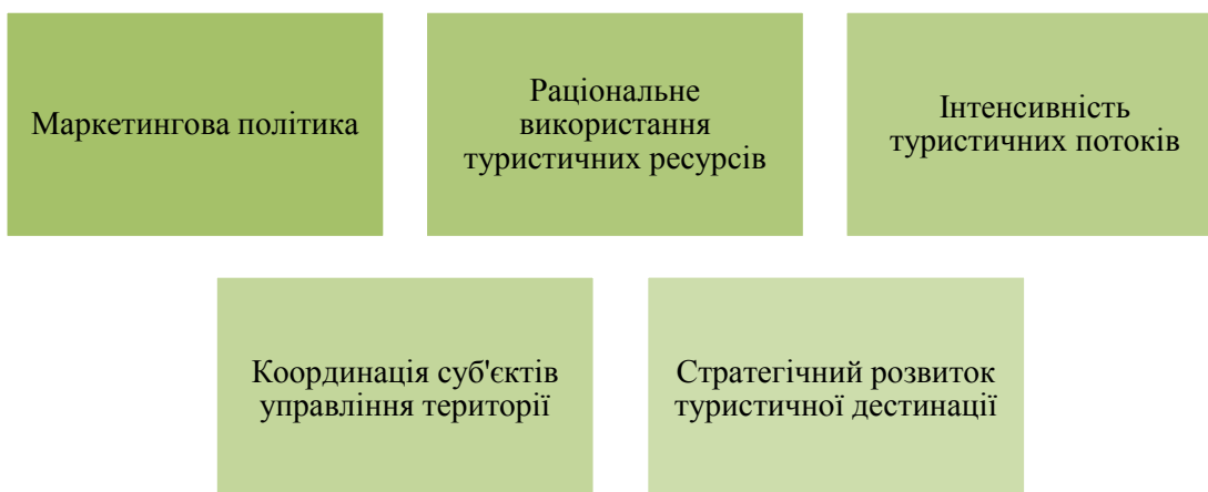
Рис. 2. Сфери діяльності, в яких здійснюється управлінські заходи відповідно концепції життєвого циклу

управлінські заходи залежно від етапу життєвого циклу туристичної дестинації.