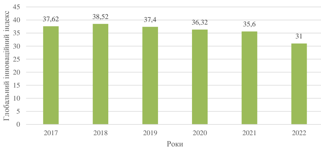
Рис. 3. Динаміка Глобального інноваційного індексу в Україні у 2018 – 2022 рр.

Водночас, починаючи з 2018 р. спостерігається постійне зниження інноваційного потенціалу підприємств України, про що свідчить спадний тренд аналізованого показника із 38,52 у 2018 р. до 31 у 2022 р. Низькі значення Глобального інноваційного індексу в Україні в аналізованому періоді характеризують вітчизняні підприємства як технологічно відсталі, із низьким рівнем інноваційного розвитку, застарілою технологічною базою та низькими обсягами фінансування інноваційних науково-дослідних інституцій.