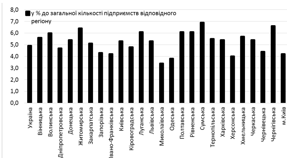
Рис. 3. Розподіл регіонів за кількістю середніх підприємств в Україні за 2016 р.

Розглянемо кількості українських підприємств середнього бізнесу у розрізі регіонів за 2016 р. (рис. 3).