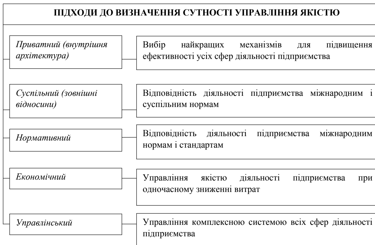
Рис. 1. Підходи до визначення сутності управління якістю