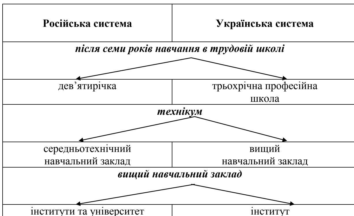
Рис. 2. Відмінності функціонування професійної освіти в РСФСР та УСРР

До семи років трудової школи між російською та українською системами не було розбіжностей, а далі розпочиналися структурно-схематичні відмінності: після семи років навчання в російській системі переважала дев'ятирічка, метою якої була орієнтація на політехнічні знання і підготовку до вузу; за семи класами навчання в українській системі слідувала трьохрічна професійна школа, яка одночасно готувала учнів до «високої школи» та давала фахові знання однієї з професій. Щодо вищих навчальних закладів у Росії – це інститути для