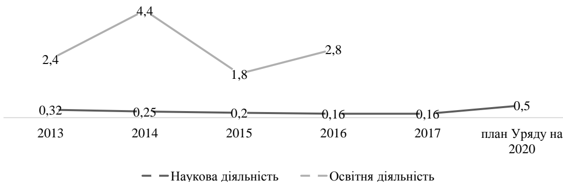
Рис. 2. Порівняння обсягів державного фінансування наукової та освітньої діяльності за відсотком витрат на фінансування до загальних видатків бюджету