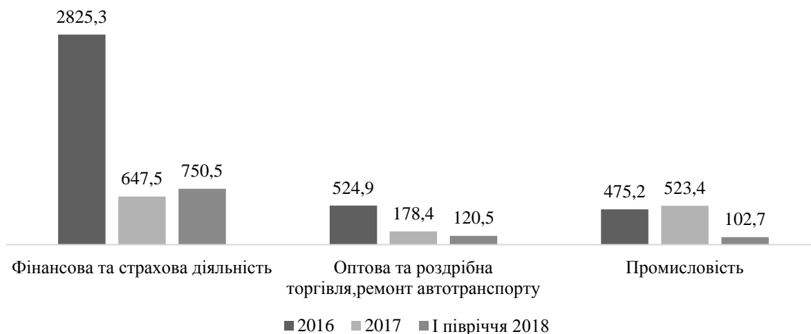
Рис. 2. Динаміка інвестування секторів економіки України за період 2016-2018 рр. Складено авторами за даними [6]

- часткове інвестування об'єктів пріоритетної важливості для з бюджету з наданням права поступового викупу інвестором частки, що належить державі в об'єкті інвестування.